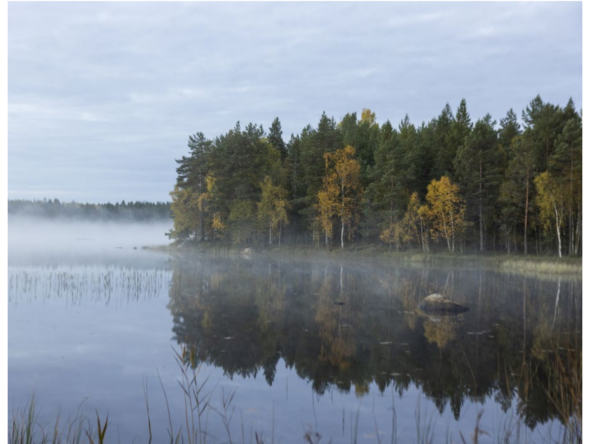
Landsbygds- och infrastrukturdepartementet