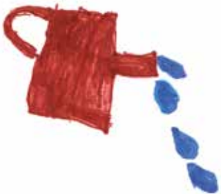
Kosteutta, valoa ja lämpöä