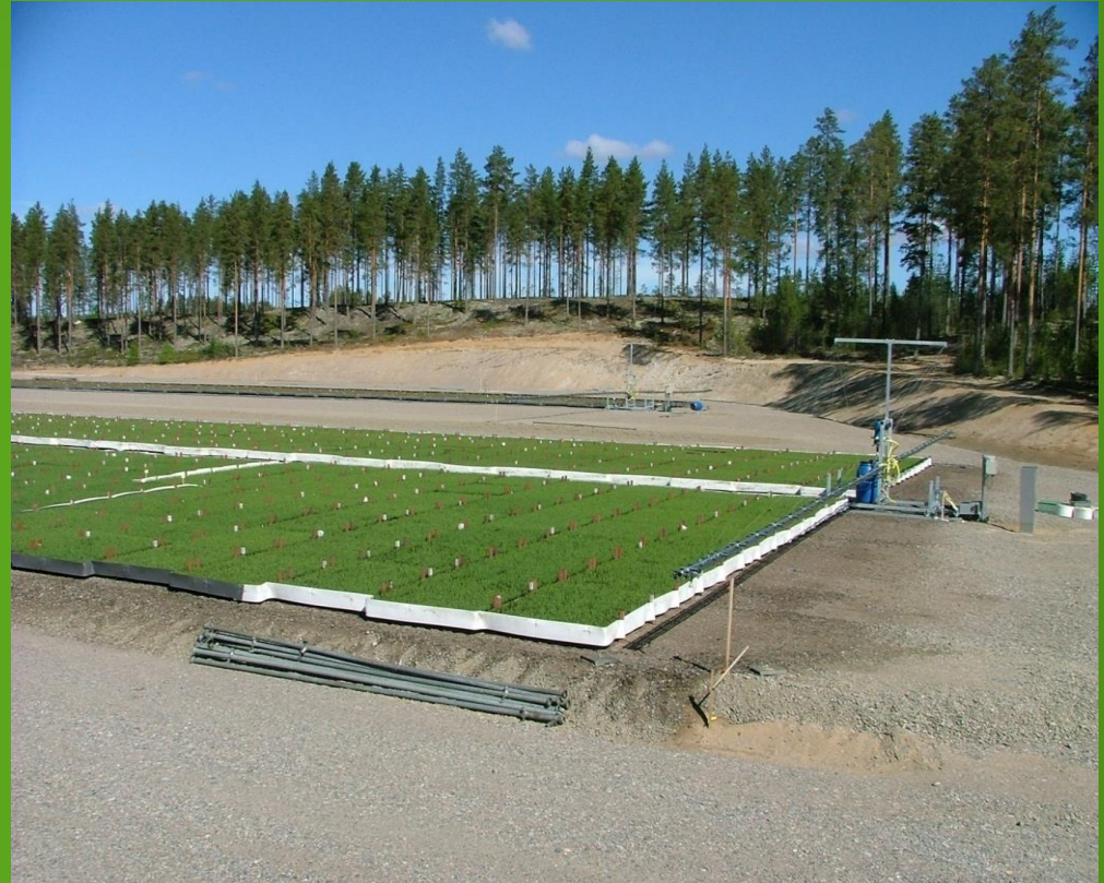
Esko Ikäheimonen taimitarhanjohtaja, osakas