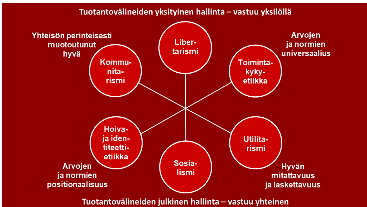
Kuvio 1 Oikeudenmukaisen teorialaaja ja niiden pääoletukset

Nämä vastakkainasettelut paljastavat kuusi erilaista oikeudenmukaisuuden teoriaa, jotka on esitetty kuviossa 1.