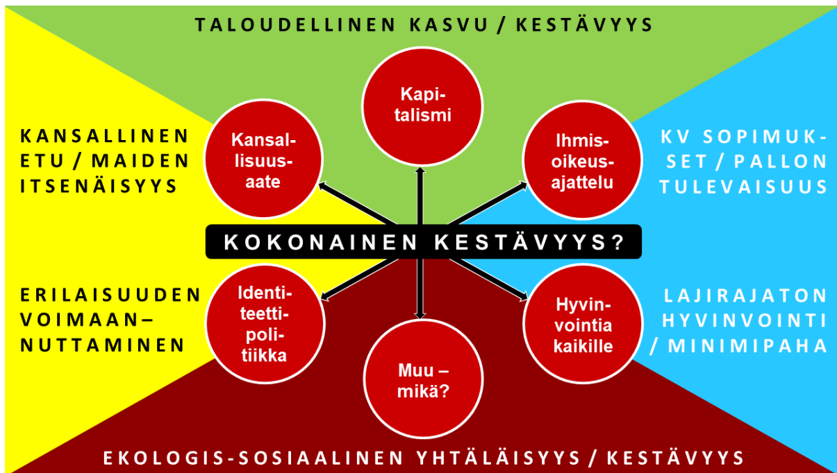
Kuvio 4 Kokonaisen kestävyden jännitteet oikeudenmukaisuuden kartalla

Oikeudenmukaisuuden kartalla, kuten se on esitetty kuviossa 4, näkyy selvästi jännite toisaalta rikkaampien maiden kansallisen edun ja toisaalta planeetan ja köyhempien maiden etujen välillä. Populistiset paineet voivat saada vaa’an kallistumaan niin, että kansainvälisiä sopimuksia pidetään taakkoina. Niiden vaikutuksia yritetään sitten lieventää milloin milläkin keinolla.